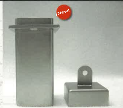
③ ハーフサイズ 染色バット

・単独で使用する場合には、カゴ側面の横のバーをつまむことでカゴが 適度な角度に倒れ、染色バットに横置きで容易に収納でき、少ない液 でも浸漬が可能になります。